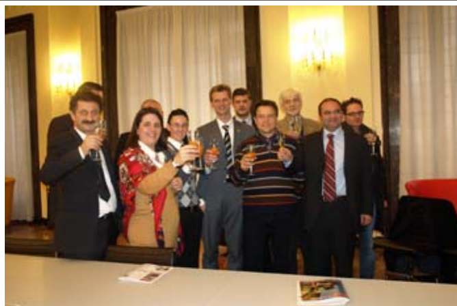
Barbara Degani, Presidente della Provincia con tutti i componenti della Giunta Provinciale

Un bilancio dei primi sei mesi di attività della nuova amministrazione provinciale e un quadro delle scelte fondamentali che segneranno il corso del 2010. Sono stati questi i temi di un incontro con la stampa avvenuto a palazzo Santo Stefano e al quale hanno partecipato la presidente della Provincia di Padova Barbara Degani e i componenti della Giunta al completo. "L'amministrazione - ha detto la presidente Degani - si è attivata innanzitutto per rispondere alle esigenze delle famiglie, delle imprese e più in generale del sistema economico. Un importante risultato è stato quello ottenuto ieri l'altro con il trasferimento alla Provincia delle deleghe regionali in materia urbanistica. Un risultato