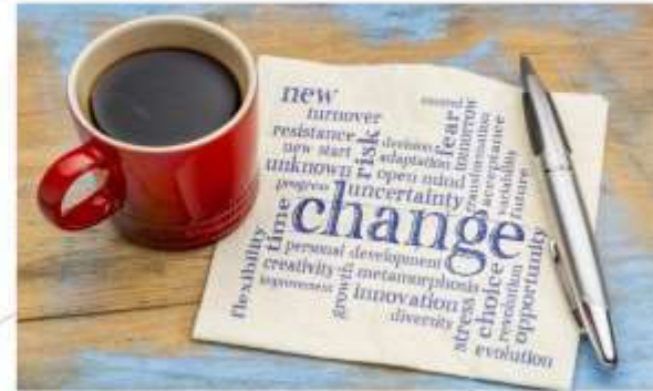
Iniziativa finanziata con il contributo di Regione Veneto, realizzata all'interno del Progetto "Training partecipativo in vitality community", Ente Capofila Fondazione O.I.C.