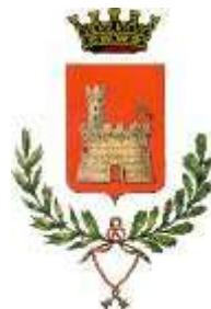
Comune di Cittadella