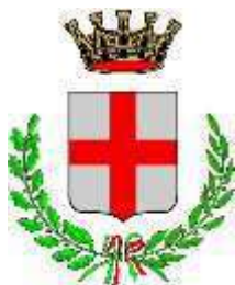
Comune di Camposampiero