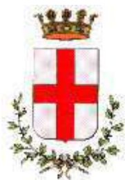
Comune di Padova