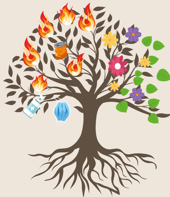
Illustrazione di Enrico Castellano della classe 2C dell'ISS A.Scotton di Breganze (VI)